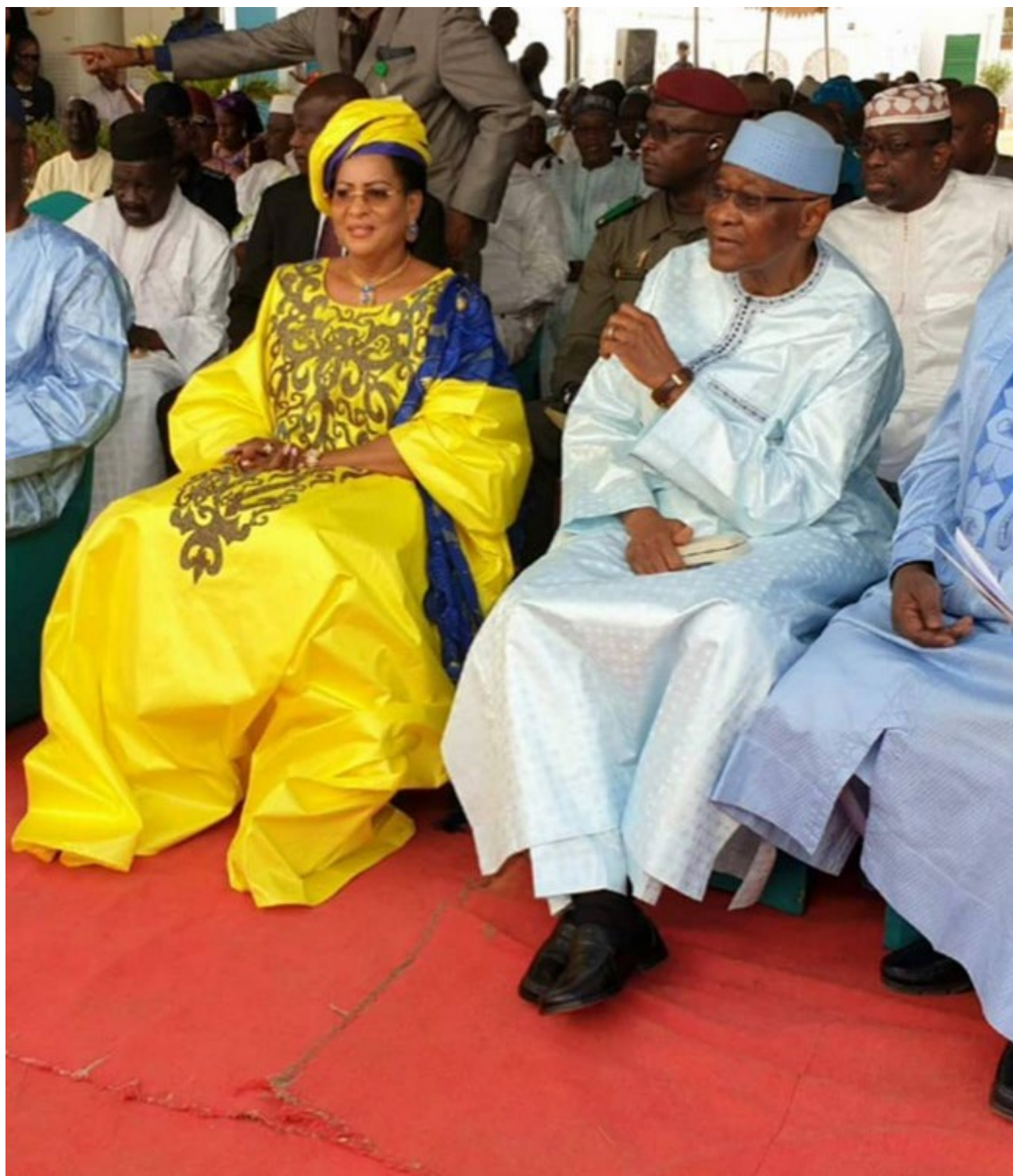
ATT et son épouse lors de la cérémonie